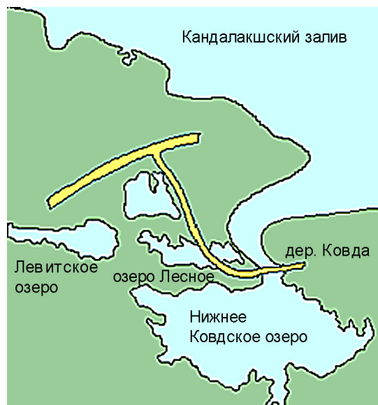
Рис. 1. Окрестности села Ковда Мурманской области.