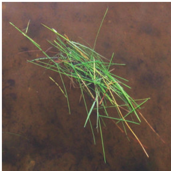
Рис. 4. Пучок травы, собранный ондатрой.