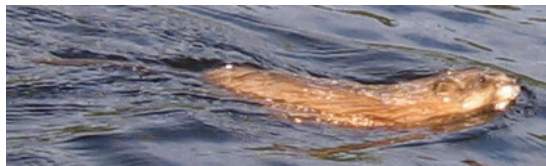
Рис. 3. Ондатра, плывущая по озеру.

В работе А. Аникина упоминаются три норы: две под дамбой и одна на юго-западном берегу озера. Под дамбой появилась, по крайней мере, одна новая нора (обозначена на рис. 2), остальные три норы также используются ондатрой. Новая нора находится ближе к южному берегу озера относительно старых. В той же стороне на краю дамбы есть небольшое отверстие, диаметром около 8 см. Возможно, это вентиляционное отверстие. Выход из норы также можно обнаружить, наблюдая за передвижениями ондатры и по пучкам травы, плавающим перед входом.